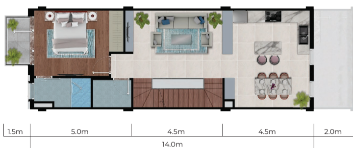
Mặt bằng tầng 1