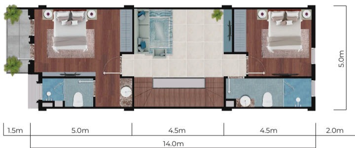
Mặt bằng tầng 2