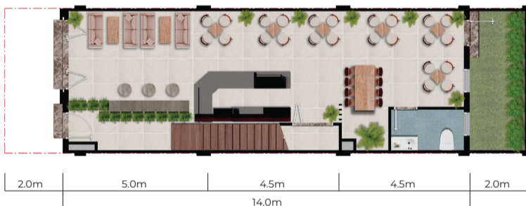
Mặt bằng Kinh doanh